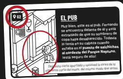
Carta de Caso, parte trasera

¡No intentéis simplemente adivinar! Debéis encontrar una escena en el mapa de la ciudad que confirme vuestra solución.