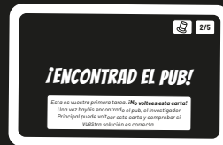
Carta de Caso, parte delantera

¡No intentéis simplemente adivinar! Debéis encontrar una escena en el mapa de la ciudad que confirme vuestra solución.