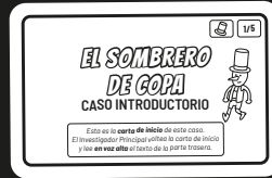
Carta de Inicio

Todo el texto de las cartas debe leerse siempre en voz alta y clara, ¡porque a menudo contiene información importante! Del mismo modo, las ilustraciones de las cartas deben ser vistas por todos los jugadores.