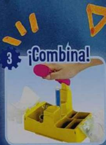
¡Monta tus rotuladores en un click!