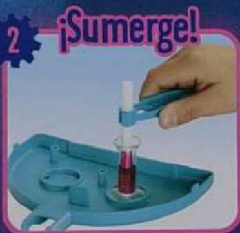
Sumerge el filtro en la tinta y observa como absorbe el color.