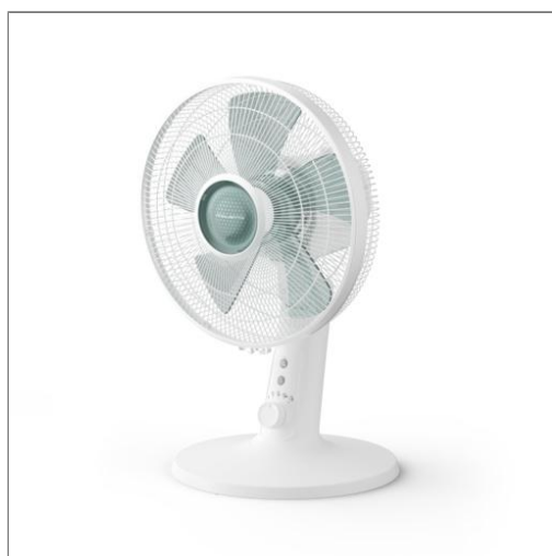
Turbo Silence Extreme de Rowenta, Ventilador de mesa, Frescor excepcional, silencioso Ventilador de mesa VU2740F0