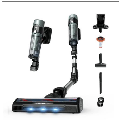
X-Force Flex 10.80 de Rowenta, Aspirador Sin Cable, hasta 120 AW, con LEDs azules y ajuste automático de potencia según el tipo de suelo, gran autonomía Aspirador Sin Cable RH7A36E0