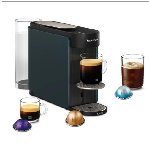
KRUPS Nespresso Vertuo Up, Cafetera de cápsulas, 7 tamaños de taza, Nespresso Smart, Azul océano Cafetera de cápsulas XN9404F0