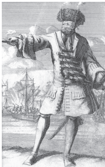
El pirata inglés Barbanegra, el terror de los mares en el siglo XVIII, era famoso por el pavoroso humo negro que envolvía su rostro durante los combates. El truco era que escondía bajo el ala de su sombrero unas mechas de combustión lenta que encendía antes de abordar un barco enemigo.

E l 1 de junio de 1282 todo estaba preparado para que los reyes Pedro III de Aragón (1240-1285) y Carlos I de Sicilia (1226-1285) se batieran en duelo. Pero este no se llevó a cabo. Tras años de continuas batallas para ver cuál de los dos se hacía con la corona de Nápoles, finalmente Carlos desafió a Pedro a resolverlo mediante un duelo. Ambos debían de presentarse acompañados de cien hombres en un campo cercano a la villa y luchar hasta la muerte de todos. Pedro III llegó el primero, muy pronto, al lugar elegido y, como no encontró a nadie, se marchó, obligando a un notario a levantar acta de la ausencia (y, por tanto, derrota) del enemigo. Horas más tarde, aparecería Carlos de Anjou que, como tampoco encontró a sus contendientes, abandonó la escena. Algunos asegurarían después que la no coincidencia de ambos monarcas en el lugar del duelo obedeció a un pacto secreto.