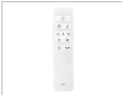
Mando | Etiqueta energética