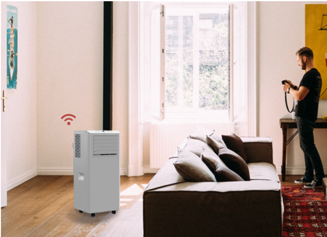
Modelo expuesto aire acondicionado Tibet