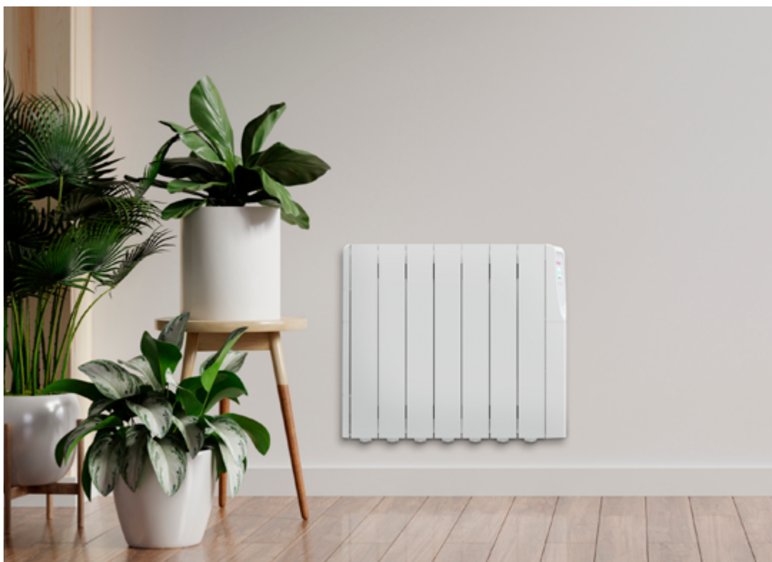
Modelo expuesto Z1200WI Blanco

EMISOR TÉRMICO FLUIDO PROGRAMABLE WIRELESS