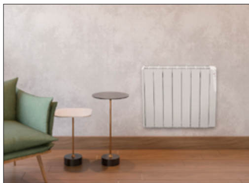
Detalle | Detalle APP | Escena Z1000WI