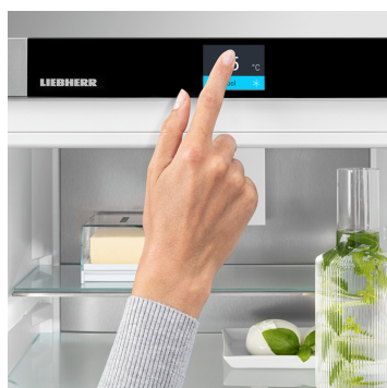
Pantalla Touch & Swipe

Su Liebherr está en la cocina pero, si lo desea, lo encontrará en Internet en todo momento: el SmartDeviceBox integrado abre la puerta a todas las ventajas de Smart Home. Solo tiene que enchufar su Liebherr, encenderlo y conectarlo con la red mediante su WiFi.