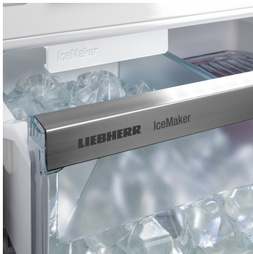
IceMaker con toma de agua fija

¿Quedan todavía cubitos de hielo? Con el IceMaker se evitará esta pregunta, pues él mismo toma el agua directamente del grifo a través de su conexión fija de agua. La función MaxIce le permite producir hasta 1,5 kg de cubitos de hielo al día. El versátil separador del compartimento de hielo le permite elegir la cantidad de cubitos de hielo que quiera almacenar. Fácil y a su gusto.