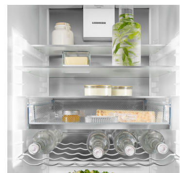
Pared trasera de SmartSteel

Su Liebherr obedece a su dedo: gracias a la pantalla Touch & Swipe, podrá controlar su frigorífico de forma intuitiva y sencilla. Solo tiene que seleccionar funciones como «SuperCool» en la pantalla de color pulsando y arrastrando el dedo. La temperatura se regula igual de fácil. ¿Y si no usa la pantalla en ese momento? Entonces, se muestra la temperatura real.